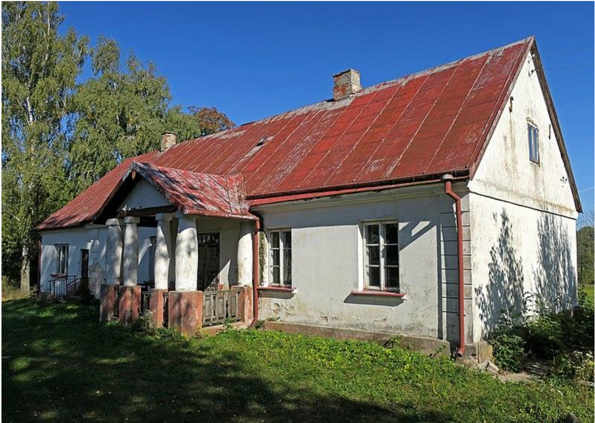
Rysunek 3. Plebania w Zespole Kościoła Parafialnego p.w. św. Jana Chrzciciela

Zbudowana w 1859 r. W 1972 r. powiększona o jednoosiową przybudówkę od północy. Plebania klasycystyczna, murowana z cegły, tynkowana. Plebania zbudowana jest na planie prostokąta, parterowa, pięcioosiowa. Ganek wsparty na dwóch parach wybrzuszonych kolumn toskańskich. Ściany zwieńczone gzymsem, na narożach boniowane w tynku. Wnętrze dwutraktowe. Bryła zwarta z użytkowym poddaszem. Portyk wsparty na czterech kolumnach nakrytych dużymi płatkami echinusa, trójkątny tympanon.