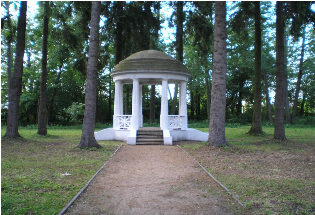
Rysunek 4. Altanka ogrodowa w zespole dworsko-parkowym