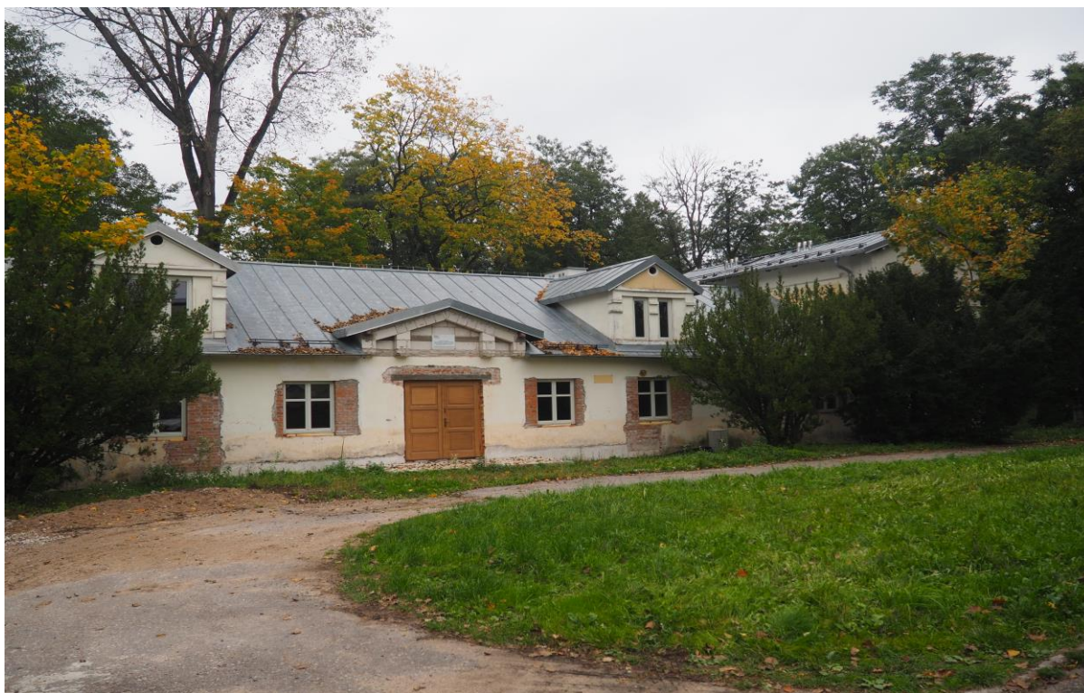
Rysunek 1. Dwór w zespole dworsko-parkowym

Dwór Wagów zbudowano około 1852-1865 r., przebudowany go w 1964 r. Obecnie jest to parterowy dwór z piętrowymi skrzydłami bocznymi. Dwór otacza piękny XIX wieczny park krajobrazowy. Jest idealne miejsce na odpoczynek. Dwór w typowym położeniu ogrodowym z początku XIX w., murowany, na planie prostokąta, dwutraktowy, narożniki skrzydeł są opilastrowane, zwieńczone głowicami. Skrzydła podzielone są poziomym gzymsem nad oknami parteru. W skrzydle zachodnim okna zamknięte łukiem półkolistym z opaskami. Pilastry przechodzą w fantazyjnej linii zwieńczenie trójkątnego szczytu. Dworek (dwa skrzydła boczne) posiada cechy stylu eklektycznego, który wyraża się w zdobnictwie pilastrów i okien. Obecność skrzydeł bocznych nawiązuje do rzutu tradycyjnych narożnic dworu polskiego. Dach dwuspadowy. Korpus dworu uprzednio drewniany, obecnie murowany. Od 15 października 2009 roku według aktu notarialnego Repertorium A numer 4609/2009 jest własnością Gminy Grabowo.